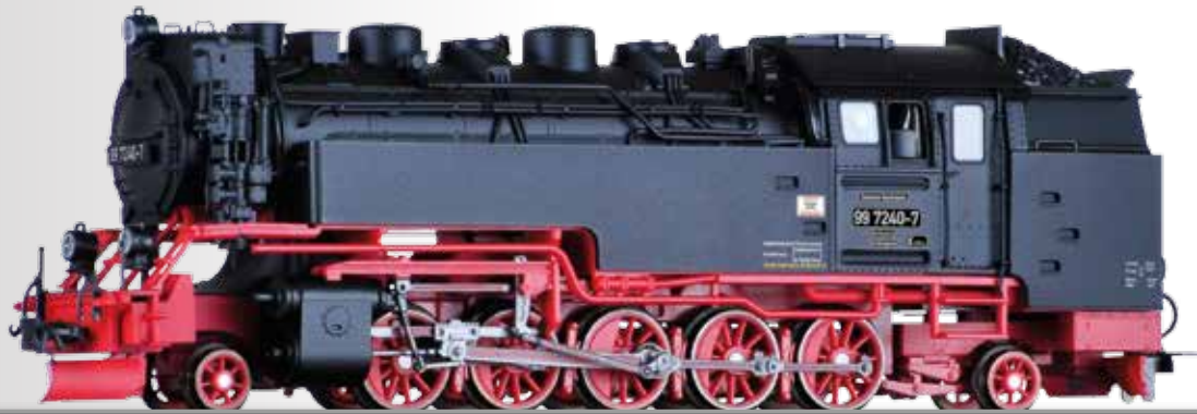
Dampflokomotive 99 7240-7 der DR Steam locomotive 99 7240-7 of the DR