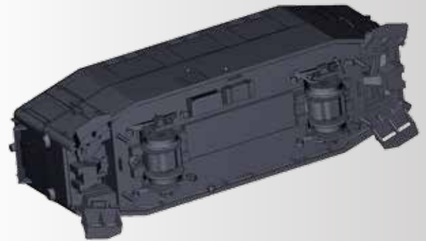
Arbeitsstand November 2017

FORMNEUHEIT: Triebwagen T1 der MEG (Mittelbadische Eisenbahn-Gesellschaft) NEW: Rail car T1 of the MEG (Mittelbadische Eisenbahn-Gesellschaft)