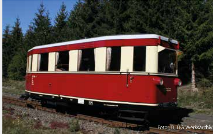
Abbildung zeigt HSB-Museumswagen

FORMNEUHEIT: Triebwagen VT 133 der DR NEW: Rail car class 133 of the DR